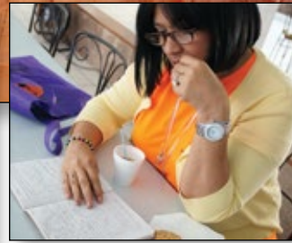
Study and growth