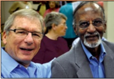
Asesoramiento por mentores