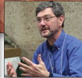
Escuchando y aprendiendo