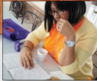
Estudio y crecimiento