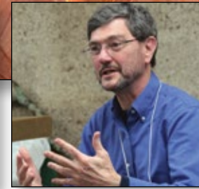
Listening and learning