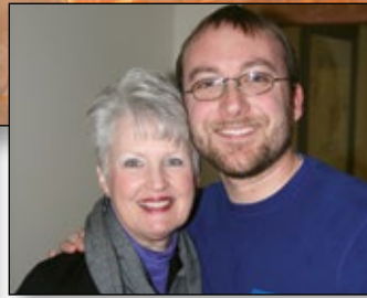
Deepening relationships and community