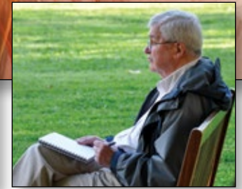
Silence and Reflection